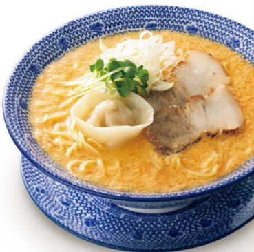
卵とじ醤油らー麺

昼は「卵にしゃがれ」、夜は「餃子食堂マルケン」と1つの店舗で2つの業態を融合させました。業態名にある通り、卵は高栄養価・濃厚・コクがある「龍のたまご」を使用、スープも「化学調味料不使用」等こだわりを見せています。