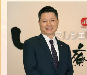
2021年12月吉日 代表取締役

このような状況ではありますが、餃子食堂マルケンの進化、街の焼鳥屋さんの出店拡大など、未来を見据えた業態展開を推し進めてまいりますので、株主の皆様におかれましては、今後ともご支援を賜りますようお願い申し上げます。