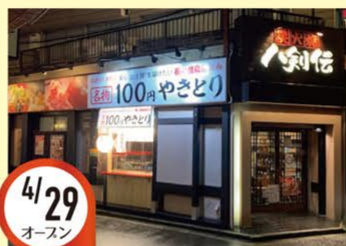
4/29 オースン 北野田駅前店 大阪府堺市