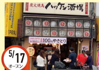
5/17 オースン 放出駅前店 大阪府大阪市