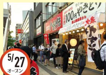
5/27 オースン 白島店 広島県広島市