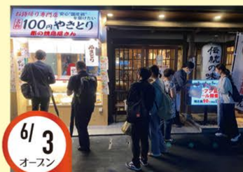
6/3 オースン 新水前寺駅前店 熊本県熊本市