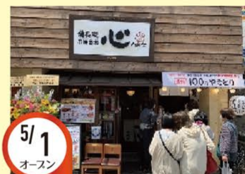
5/1 オースン JR桃谷駅前店(FC) 大阪府大阪市