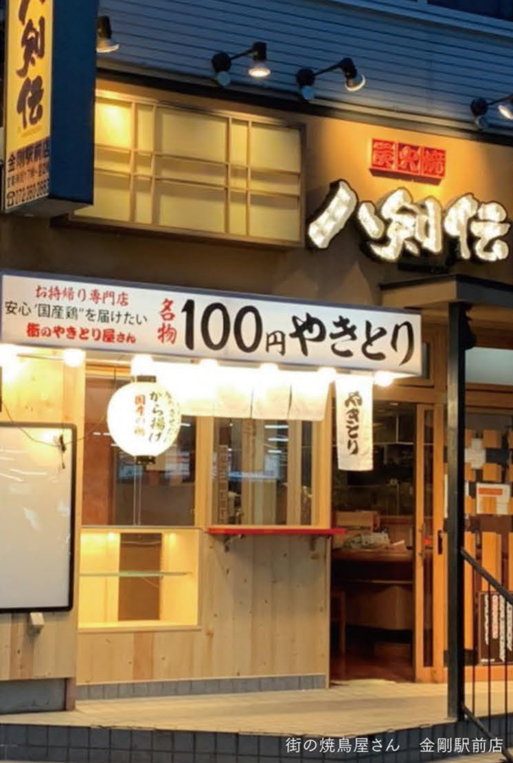
街の焼鳥屋さん 金剛駅前店