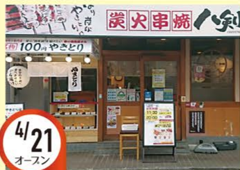
4/21 オースン 千川駅前店 東京都豊島区