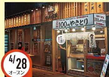
4/28 オースン ときわ平店 千葉県松戸市