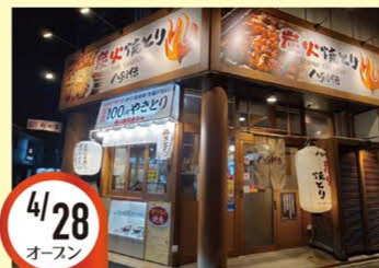
4/28 オースン 三郷駅前店 愛知県尾張旭市