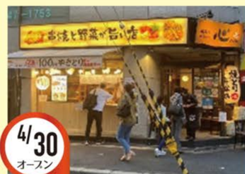
4/30 オースン 阿波座店 大阪府大阪市