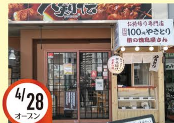
4/28 オースン 北仙台駅前店 宮城県仙台市