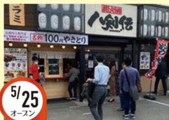
5/25 オースン 青江店 岡山県岡山市