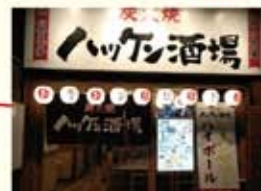
ハッケン酒場東伏見店