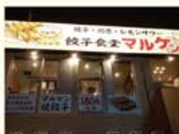
餃子食堂マルケン今福鶴見店