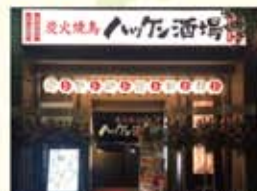
ハッケン酒場南草津店