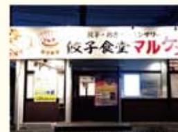
餃子食堂マルケン姫路砥堀店