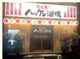
ハッケン酒場五日市コイン通り店