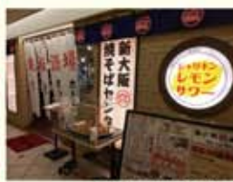
新大阪焼そばセンター