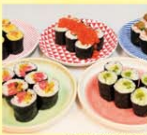
酒場とらず名物「あて巻」

お酒のアテとなる食材を入れた細巻「あて巻」を名物とした新業態「酒場とらず」を大阪市西区西本町にグランドオープンいたしました。名物の「あて巻」は、うに+漬け卵黄の「うにたま」や、サーモン+いくらの「サーモンファミリー」など約20種類と豊富にご用意しております。近隣で働くサラリーマンやOLをターゲットにしており、仕事帰りにふらっと立ち寄っていただき、明日の活力を提供できる場を目指してまいります。