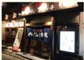
ハッケン酒場七隈店