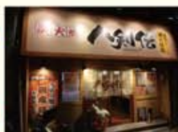
八剣伝針中野駅前店