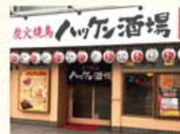
ハッケン酒場五日市駅前店