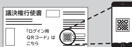
議決権行使書副票（右側）